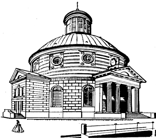
Kościół ewangelicki w Warszawie (XVIII w.)